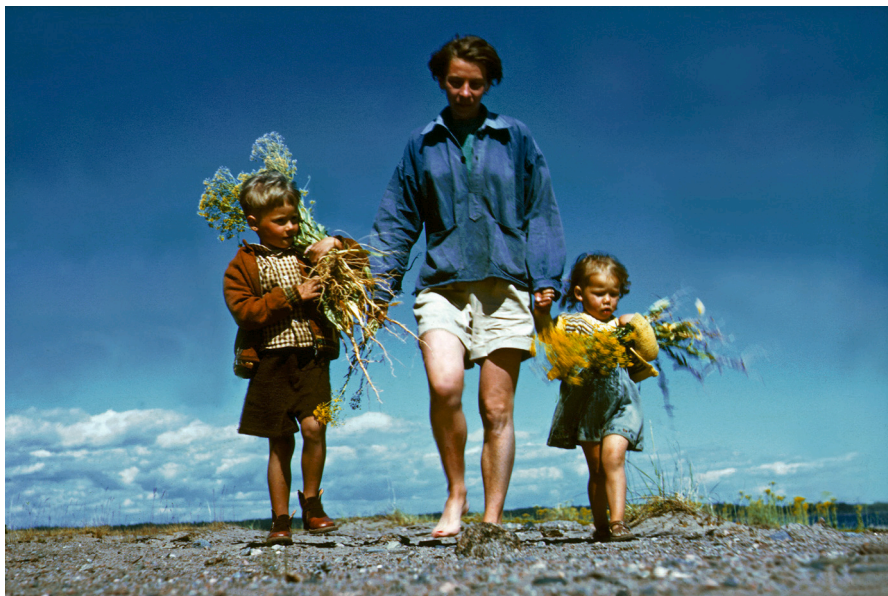
Kuva: Tove Jansson, CG Hagström