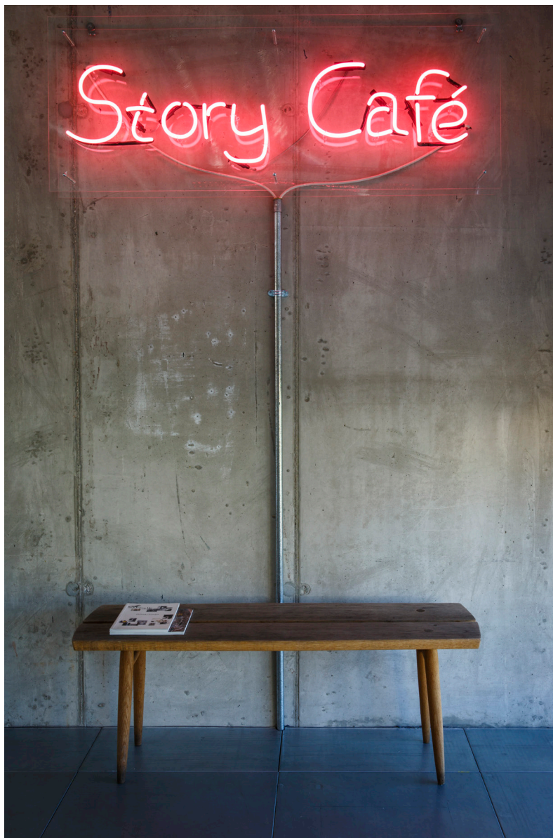
Kuva: Johanna Lecklinin Story Café -teos, Kasper Gustavsson & Jennifer Granqvist

Suomen Lontoon instituutin yhteistyökumppaneiltaan ja yleisöltään saama palaute kannustaa toimimaan rohkeasti ja luovasti myös jatkossa.